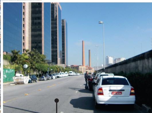
Av. Aldo Soares de Moura Andrade