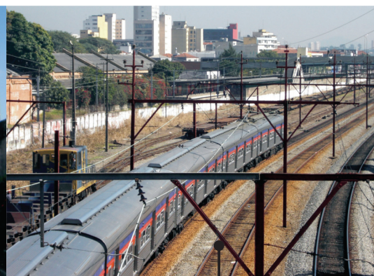
Linha Férrea CPTM