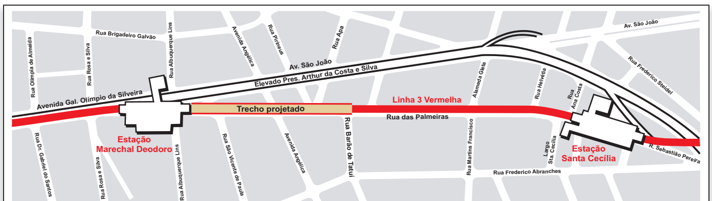
Localização do Trecho - Rua Barão de Tatuí / Estação Marechal Deodoro