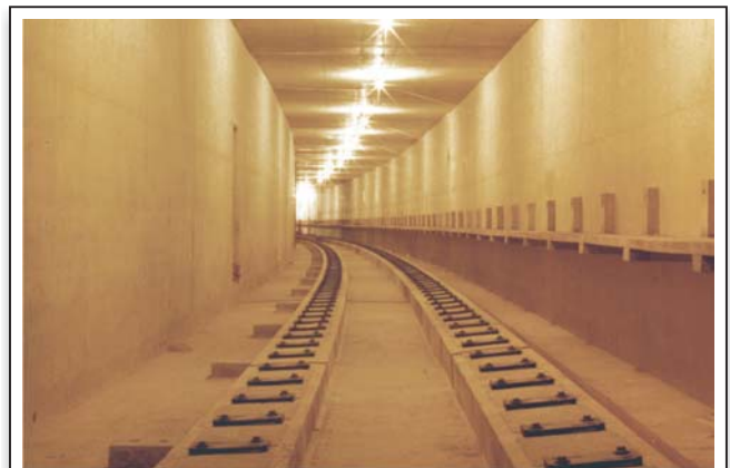
Foto Interior do Túnel