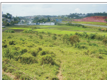
Local da Futura ETE Guatambu (TL-18)